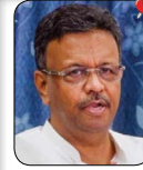
ফিরহাদ হাকিম (মেয়র, কলকাতা পুরসভা)